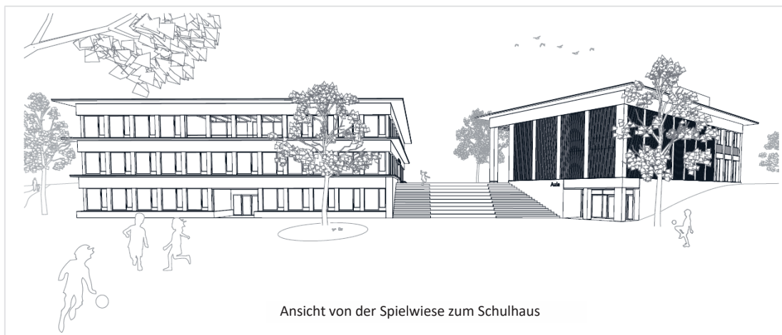
Ansicht von der Spielwiese zum Schulhaus

Bei gleichbleibendem Steuerertrag (Dezember 2023) entspricht dies einem Aufwand für die Politische Gemeinde Andwil von ca. 14 Steuerprozenten und für die Stadt Gossau von ca. 1.6 Steuerprozenten. (Achtung, bitte nicht verwechseln: Aufwand bedeutet nicht gleich Steuererhöhung.)